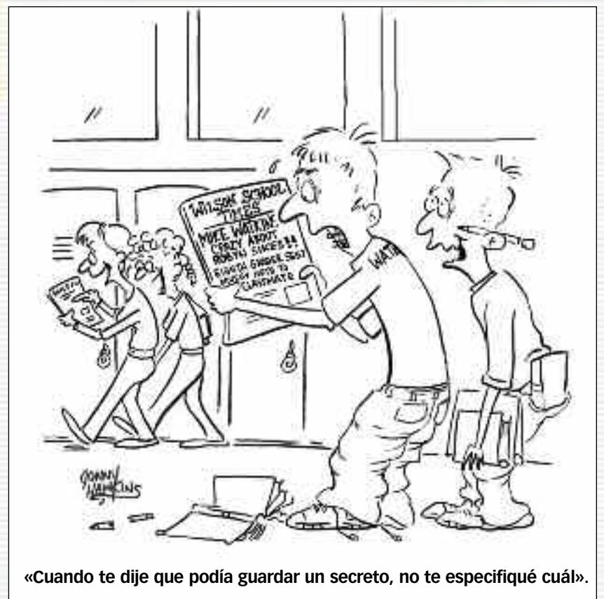
«Cuando te dije que podía guardar un secreto, no te especificué cuál».