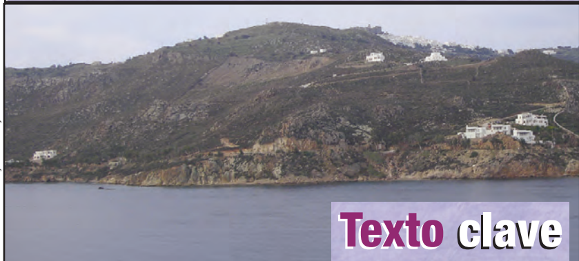
Isla de Patmos: Lyn Gateley